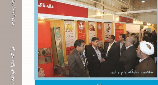
هشتمین نمایشگاه دام و طیور